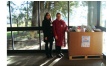
従業員の約30%が参加し、古着を恵まれない人々に寄付(EPCOS do Brasil Ltda.)