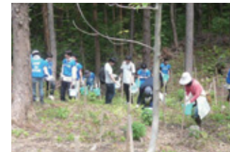
郷土に緑の森を創生しよう——という「TDKブナの森」植樹会(TDK秋田地区)

当社は、企業市民の一員として社会と共生することの大切さを改めて認識し、「学術・研究／教育」「スポーツ／芸術・