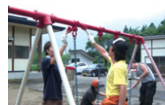
草刈り、遊具のペンキ塗りなどを行っている「保育園施設ボランティア」(TDK羽後)

文化」「環境保全」「社会福祉・地域社会の活動」という4分野の社会貢献活動を推進しています。