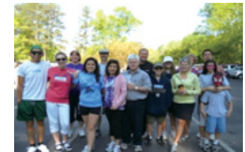
母子健康の向上を目的とした募金活動を実施(TDK Components U.S.A., Inc.)

2004年からは「TDKグループ社会貢献活動賞」を設けており、2010年は同賞に56件の応募があり、審査の結果、16件の活動が同賞に選ばれました。