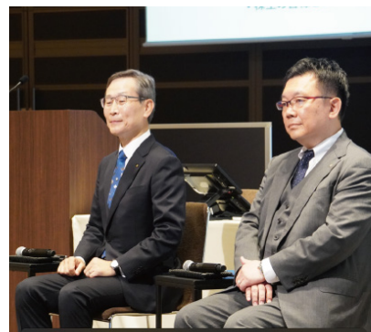
※写真は昨年の様子です。

ご来場またはライブ配信をご視聴のうえ、アンケートにご回答いただいた方の中から、抽選で 100名様に