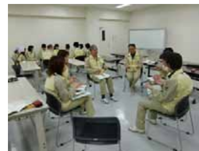
聴覚障害者の雇用促進とともに職場定着に向けた支援を実施 (TDK ラムダ(株)長岡テクニカルセンター)

TDKグループは、企業市民の一員として社会と共生することの大切さを改めて認識し、「学術・研究／教育」「スポーツ／芸術・文化」「環境保全」「社会福祉・地域社