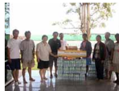
タイ洪水の被害地域に飲料水を寄付 (Magnecomp Precision Technology Public Co.,Ltd.)