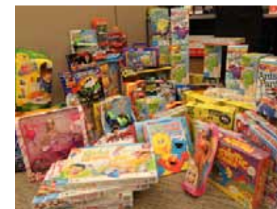
恵まれない子供たちにクリスマスプレゼントを贈る活動に寄付 (TDK Corporation of America)