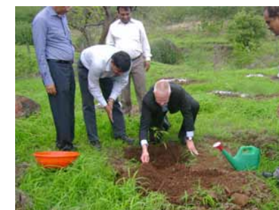
「国際環境デー」に100本の苗木を植える植樹活動を実施 (EPCOS India Private Ltd.)