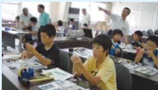
エレクトロニクス体験教室 (TDK 歴史館)

次世代を担う若者たちに、様々な知識や経験、技能等を学ぶ機会を提供していきたいと考えています。