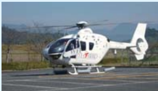
医療搬送用ヘリコプターへのヘリポート提供 (三隈川工場)

地域社会における様々な課題を当社グループの持つ資源を活用しながら、より良い社会の実現に向けて努力しています。