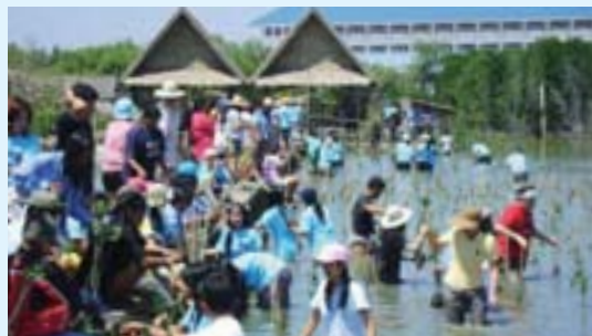
植林活動 (TDK (Thailand) Co., Ltd.)