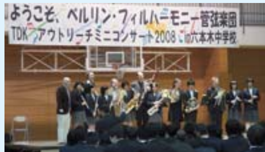
世界一流の楽団員と学生の交流演奏