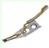
記録デバイス (HDDヘッド)