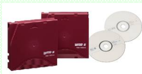
アプライド フィルム