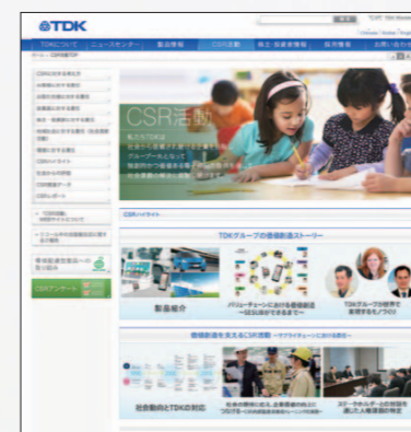
※CSR活動WEBサイト(画面は昨年度のイメージです)

2014年度の活動報告を中心に網羅的な情報とアンケートフォームを掲載しています。今後の活動や報告内容を充実させていくために、ぜひご意見をお聞かせください。