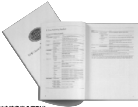
グリーン調達基準書の英訳版

TDKが独自に定めたグリーン調達基準書に基づき、取引先企業の環境管理状況の調査と購入資材に対する調査を実施。企業に対する調査結果は、課題を取引先と共有化して、改善のための参考としています。製品に対する調査結果はデータベース化し、全社で参照可能とし、より環境負荷の少ない製品の開発に役立てています。また、資材調達の国際化を視野に入れ、グリーン調達基準書の英訳版も発行しました。