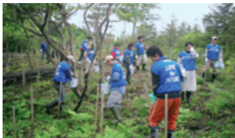
「TDK プナの森」追肥作業(秋田)