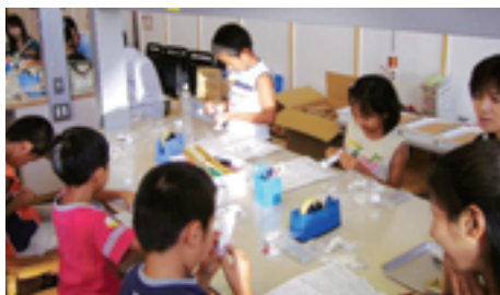
やってみよう!電子工作教室(甲府)

当社が持つ知識や経験、技能等を、社会に還元するとともに、青少年には、多様な知識や経験、技能等を学ぶ機会を提供してゆきたいと考えています。