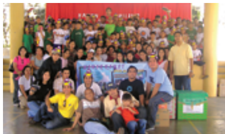
福祉施設ボランティア(TDK FUJITSU Philippines Corporation)

地域社会におけるさまざまな課題をTDKの持つ資源を活用しながら、より良い社会の実現に向けて活動をしています。